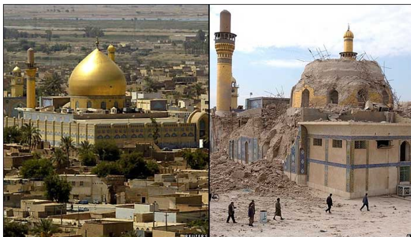
عراق بعد از دموکراسی- _ عراق قبل از دموکراسی

اگر هدف سیاستمداران آمریکا دموکراتیک کردن واقعی، جنگ با تروریست ها و کمک به ملت بیچاره بود بایستی این کار را از کشور عربستان سعودی شروع می کرد زیرا هیچ